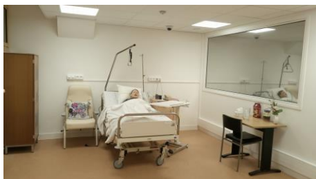
30 octobre 2018 : équipement du laboratoire de simulation en santé