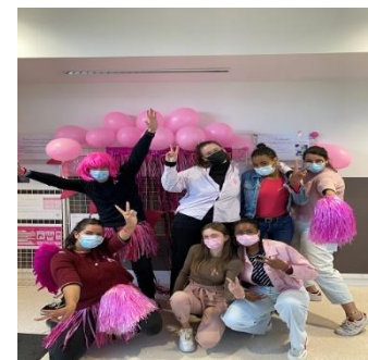
1 er Octobre 2021 : journée de sensibilisation autour du cancer du sein organisé par les étudiants du BDE

Les étudiants et élèves sont invités à participer tout au long de leur formation à des activités caritatives et sportives, à des actions de santé publique et à des exercices Plan blanc en collaboration avec le SAMU 95.