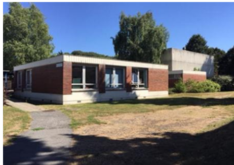
Centre Hospitalier René-Dubos