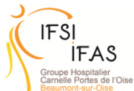
IFAS de Beaumont-sur Oise