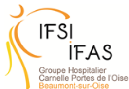
IFAS de Beaumont-sur Oise